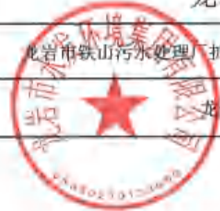
龙岩市本级财政投资建设项目缺项材料选用定价审批表