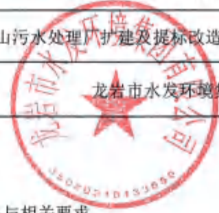
龙岩市本级财政投资建设项目缺项材料选用定价审批表