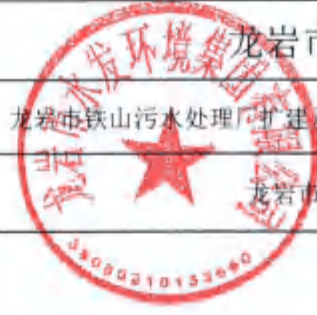
龙岩市本级财政投资建设项目缺项材料选用定价审批表