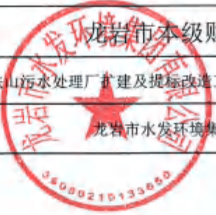
龙岩市本级财政投资建设项目缺项材料选用定价审批表