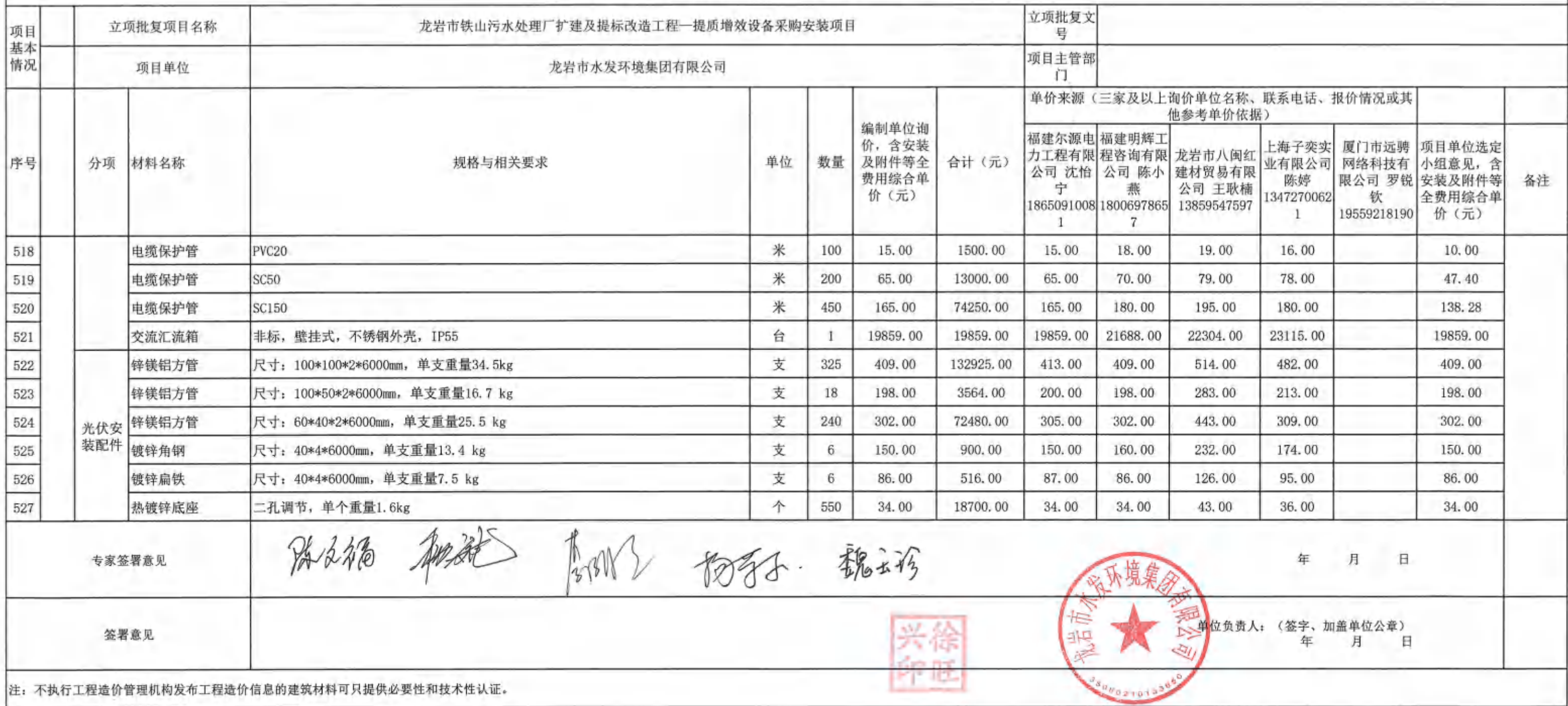
龙岩市本级财政投资建设项目缺项材料选用定价审批表